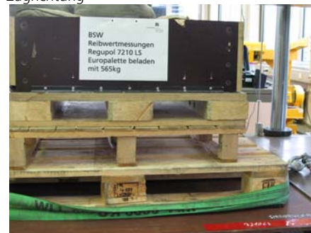
Zugkraftmessung mit Kufen parallel zur Zugrichtung